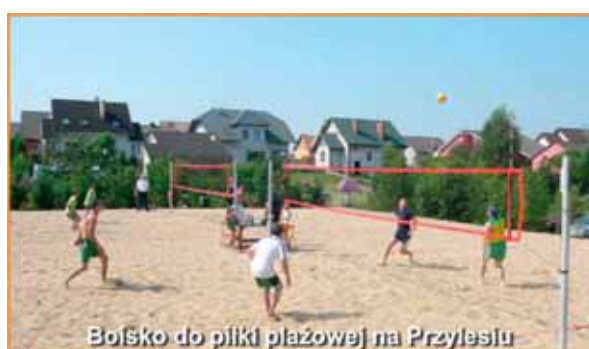
Boisko do piłki plażowej na Przylesiu