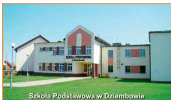
Szkoła Podstawowa w Dziembowie