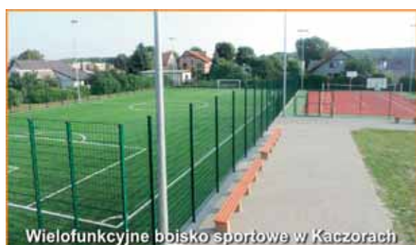
Wielofunkcyjne boisko sportowe w Kaczorach