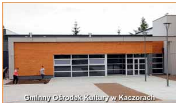
Gminny Ośrodek Kultury w Kaczorach