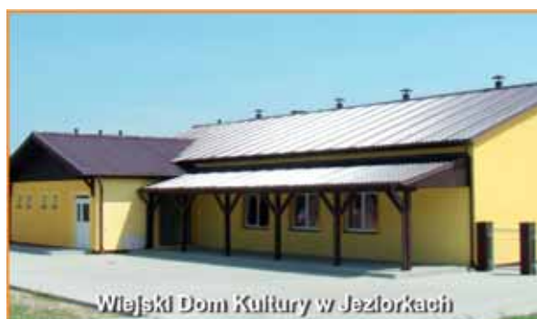
Wiejski Dom Kultury w Jeziorakach