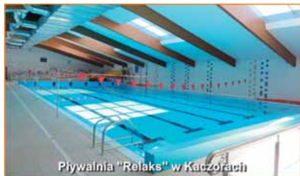
Pływalnia "Relaks" w Kaczorach