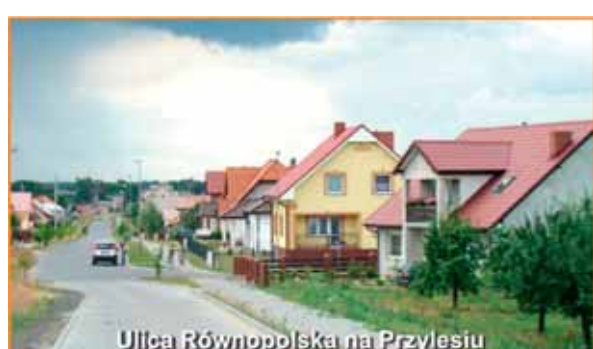
Ulica Równopolska na Przylesiu