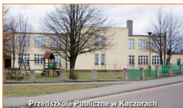
Przedszkole Publiczne w Kaczorach