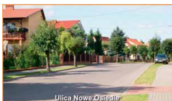
Ulica Nowe Osiedle