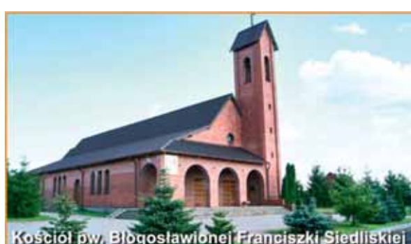
Kościół pw. Błogosławionej Franciszki Siedliszczu