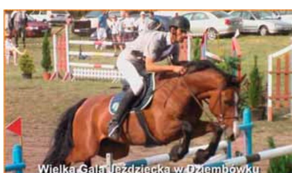
Wielka Gala Jeździecka w Dziembówku

Sportu za całokształt działalności na rzecz rozwoju sportu i rekreacji. Do tytułu zarekomendował Gminę Kaczory marszałek województwa wielkopolskiego. Uzyskanie takiego wyróżnienia za wybudowanie Krytej Pływalni w Kaczorach jest dla Gminy Kaczory kolejną motywacją do działania na rzecz rozwoju infrastruktury sportowej. W ramach cotygodniowych lekcji wychowania fizycznego na basen uczęszczają uczniowie ze wszystkich szkół z terenu gminy Kaczory. Młodzież realizuje swoje sportowe pasje w czterech Ludowych Zespołach Sportowych. Każdy klub posiada pełnowymiarowe boisko z szatniami, na trzech obiektach wybudowano trybuny. Powstałe obiekty sportowe mają być pełne uśmiechniętych dzieci, gwarantując rozwój, radość i zdrowy wypoczynek.