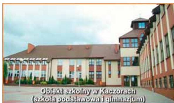
Obiekt szkolny w Kaczorach (szkoła podstawowa i gimnazjum)