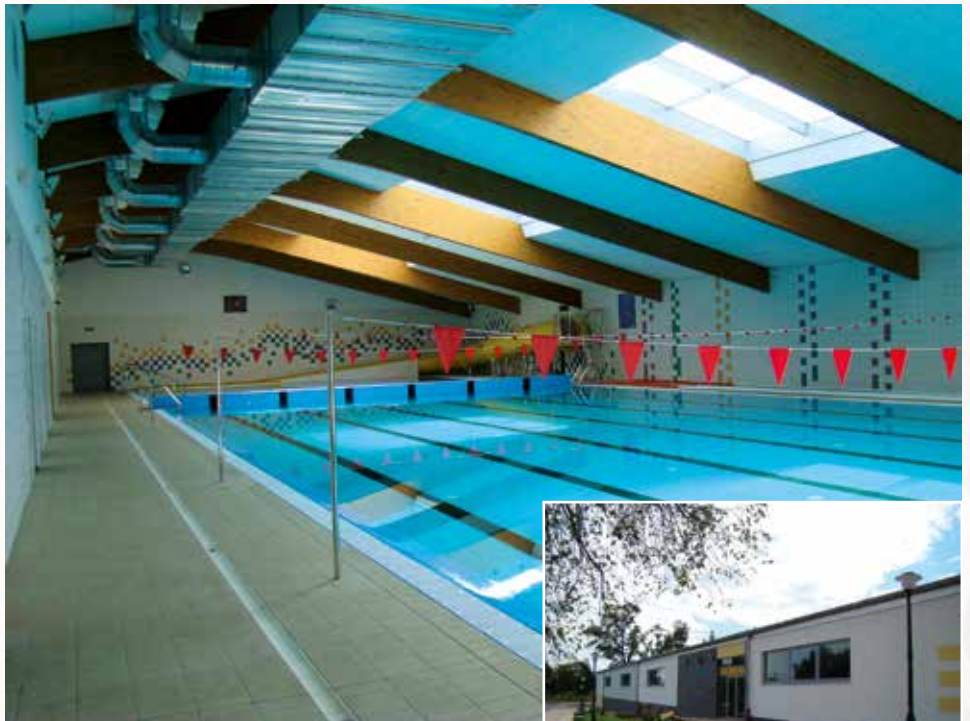
Kryta pływalnia „Relaks” w Kaczorach